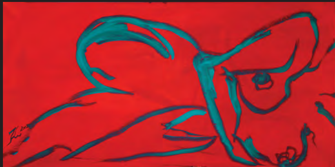
liegender akt auf rot I