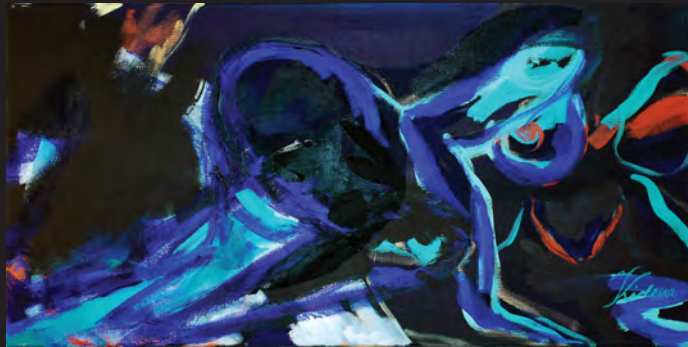
liegender akt auf blau I