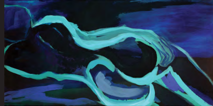
liegender rückenakt I